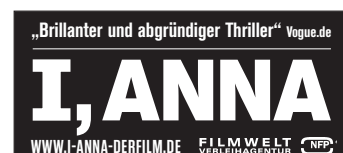
Motiv 5a und 5b: 45 x 20 mm