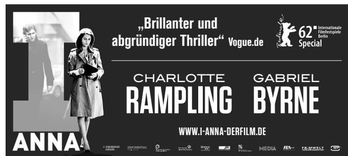
Motiv 4: 90 x 40 mm