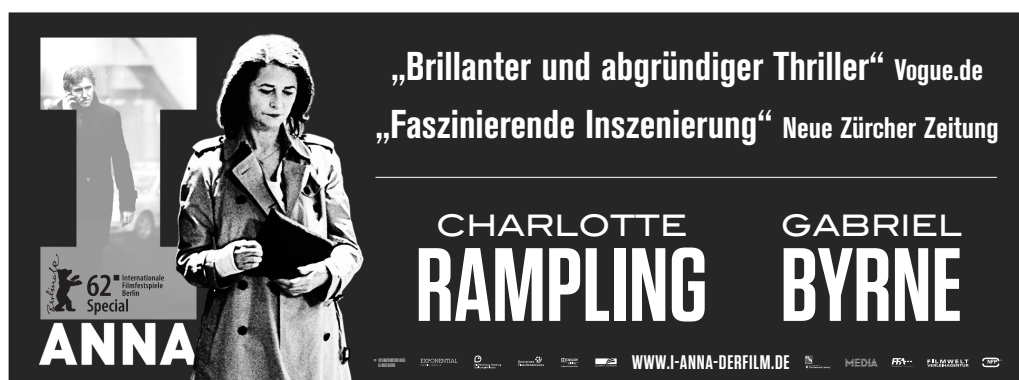
Motiv 3: 135 x 50 mm