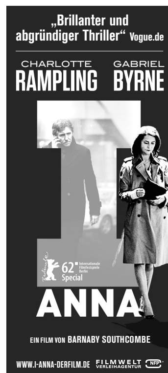
Motiv 8: 45 x 100 mm