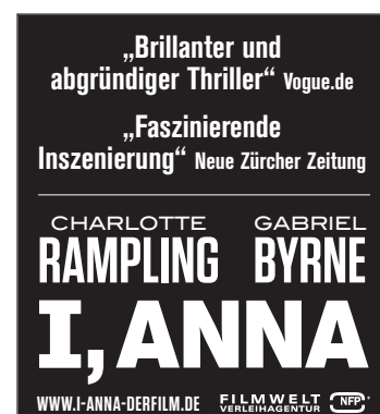
Motiv 9: 45 x 50 mm