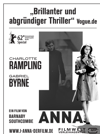
Motiv 6: 45 x 60 mm