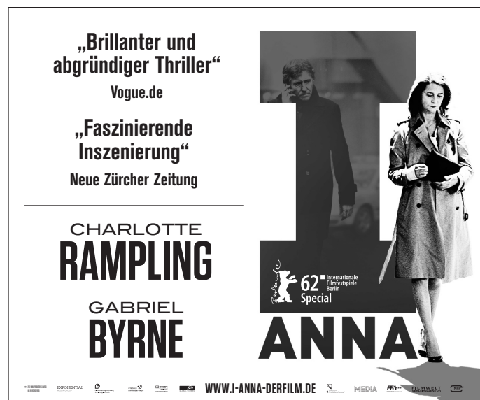
Motiv 2: 90 x 75 mm