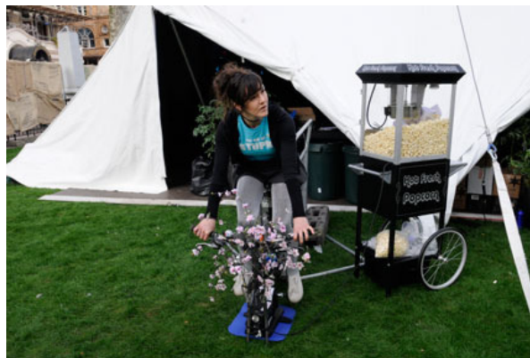
Eine Popcornmaschine - angetrieben von Wadenkraft

Protagonist Piers Guy reiste bei der UK-Premiere mit einem Tesla Roadster an, einem elektrischen Sportwagen, der in vier Sekunden von null auf hundert km beschleunigt und an der Cambridge University entwickelt wurde